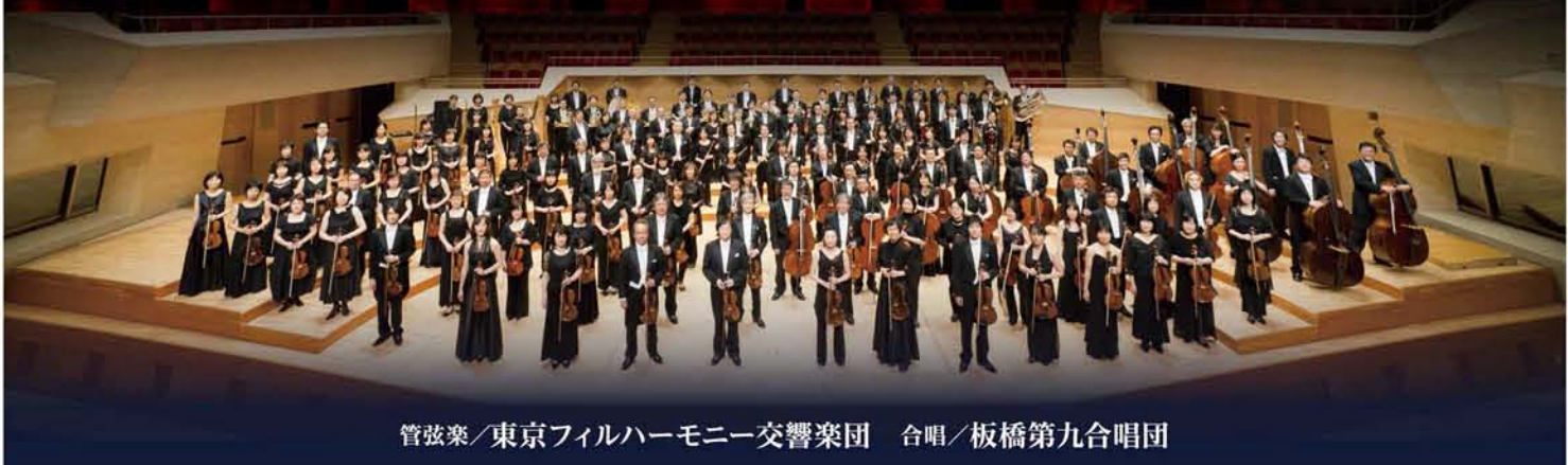
管弦楽/東京フィルハーモニー交響楽団 合唱/板橋第九合唱団