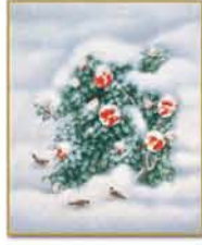
書つばき 1994年 第26回 日展 日本芸術院展

開館時間 ● 9時30分~17時00分 (入場は16時30分まで) 休館日:月曜日(ただし月曜日が祝・休日の場合は翌日) 会場 ● 区立美術館 料金 ● 一般 500円 高・大学生・65歳以上 300円 小・中学生 200円 ※20名以上団体割引あり。 ※未就学児及び各種手帳をお持ちの方の方は無料。